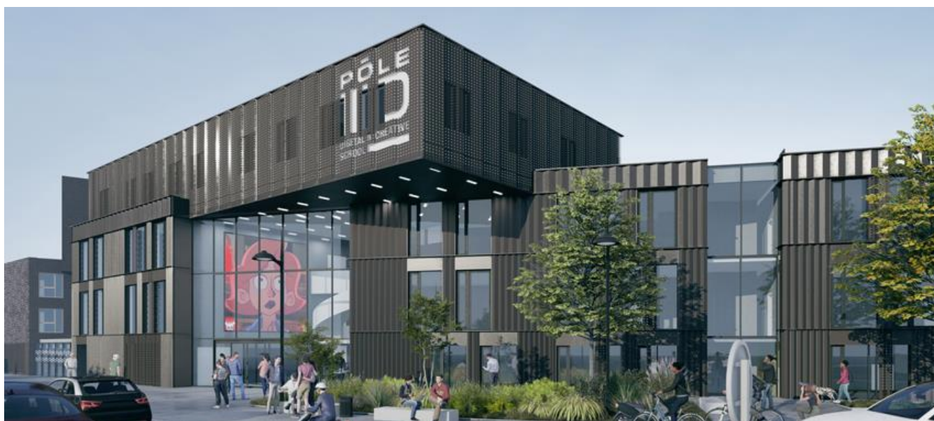
Perspective de la partie école - © De Alzua + et Archiaie

D'une surface de 5000 m 2 , le bâtiment accueillera à horizon 2025 près de 650 étudiants contre 400 actuellement et logera une centaine d'entre eux. Labelisés « Energie Positive et Réduction de Carbone » ou « E+C- » de niveau 2, les logements seront à la pointe de la performance environnementale et offriront des conditions de confort optimales aux étudiants. Ce projet novateur a la particularité de proposer un concept d'école-résidence qui invitera la ville en son sein, via sa place Agora (ouverte à tous les publics) et les différents services (restauration, co-working, média-ludothèque, amphi / cinéclub...). Les espaces pédagogiques et de travail seront ouverts 24h/24h aux étudiants. Le programme comporte des surfaces à usage pédagogique (2 800 m 2 avec ateliers et factories) et d'autres dédiées au logement des étudiants (3 000 m 2 ).