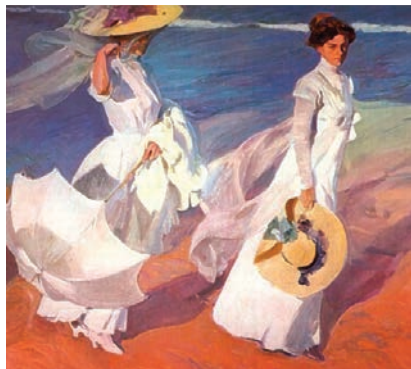
Promenade au bord de la mer Musée Sorolla, Madrid