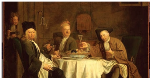
Les Buveurs de vin, Jacques Autreau Musée du Louvre, Paris