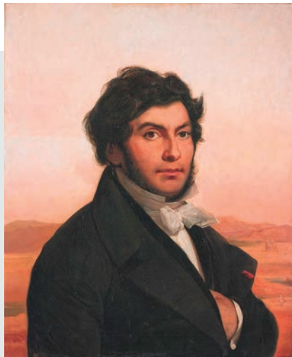
Portrait de Jean-François Champollion Léon Cogniet, Musée du Louvre (Paris)