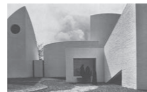
© Véra Cardot / Pierre Joly

Chaque jeudi de 13h à 13h30, venez découvrir et échanger autour d'une œuvre d'art incontournable. Grâce aux commentaires d'un conférencier, l'occasion vous est donnée d'aller au plus près des détails de l'œuvre et d'en approfondir les aspects historiques et artistiques.